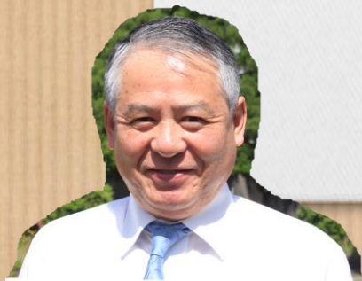
山口県立大学 社会福祉学部 教授